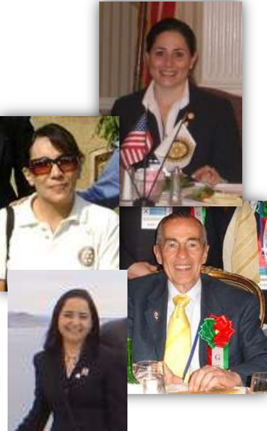
Líderes IGE 2003, 2007, 2008, 2009

Deberá su club enviar una carta proponiendo al socio, firmada por el Presidente y Secretario del club y haber hecho aportaciones a La Fundación Rotaria, cuando menos los dos últimos años.